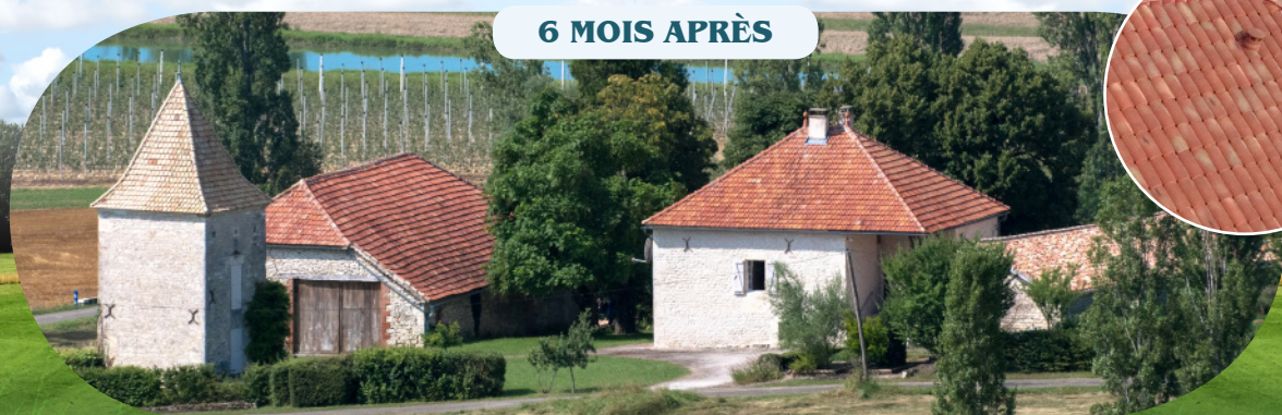
6 MOIS APRÈS

Le traitement élimine la prolifération des végétaux (mousses, lichens...) par son action fongicide et il préserve la tuile de leurs réapparitions par ses propriétés hydrofuges.